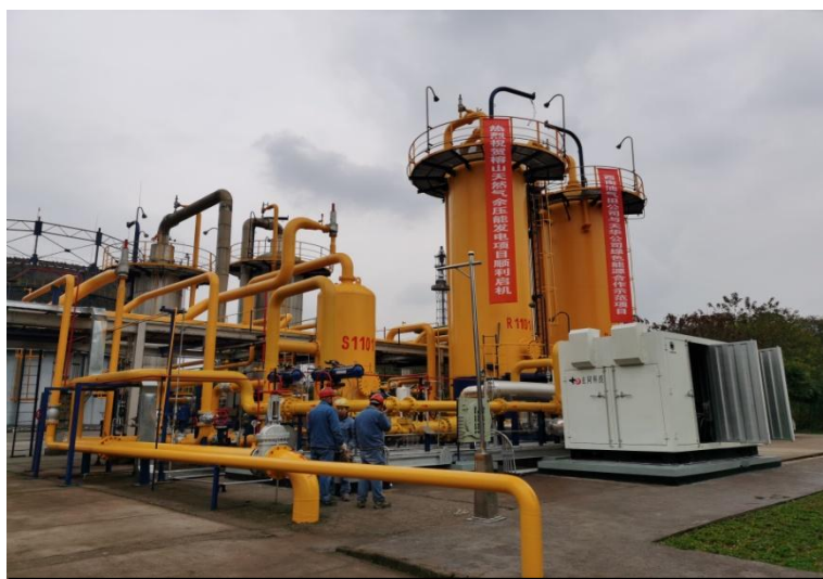
图为公司新建的压差发电一期项目

2021年，公司强化新发展理念，不断推进化工生产绿色转型，促进产业提质增效，加大环保投入，提升节能减排、绿色发展水平。公司与西南油气田公司合作开发的压差发电一期项目，主要利用工业生产中所产生的压力差能量，将其