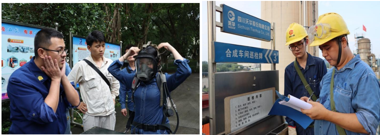
左图为现场消防培训，右图为现场巡检

章、风险辨识及票证办理、八大特殊作业、安全生产事故应急救援预案进行 11 次培训，完成新入职人员培训 69 人，承包商一级安全培训 2099 人次；大修前，组织所有参战单位进行安全环保集中考试，合格率 100%。