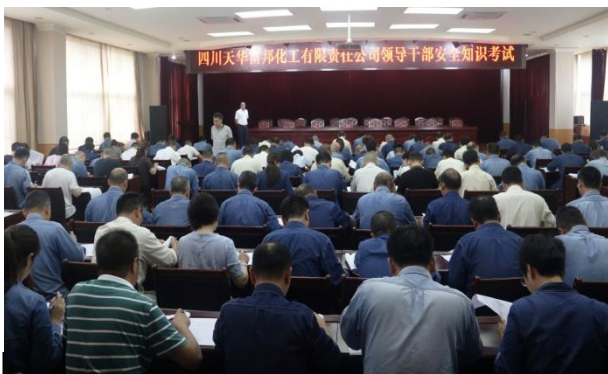
图为公司专业经理以上干部安全考试

2021年，公司召开安全生产工作会26次，组织各单位学习习近平总书记关于安全生产的重要论述和《安全生产法》等安全法律法规，并以学习内容为主组织了公司专业经理以上