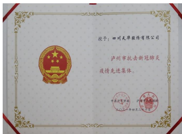
左图为天华志愿者参与核酸检测，右图为市抗疫先进集体荣誉证书