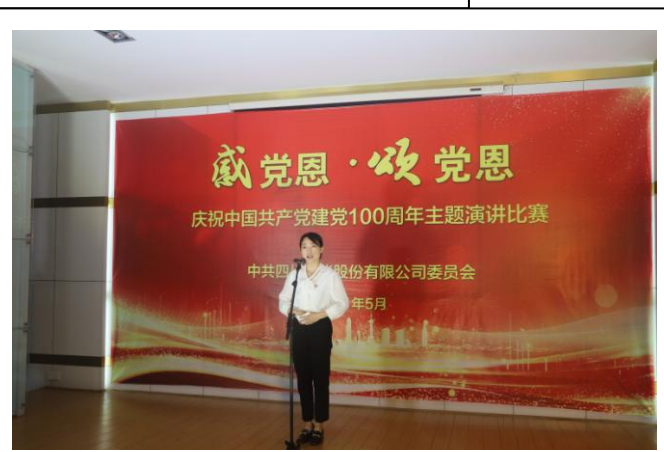
上图为公司党委中心组学习党史，下图为庆祝建党 100 周年公司开展的各项活动